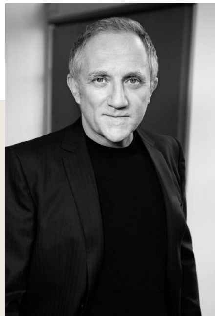
François-Henri Pinault Amministratore delegato